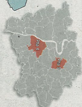
Jak si radnice rozdělily své voliče